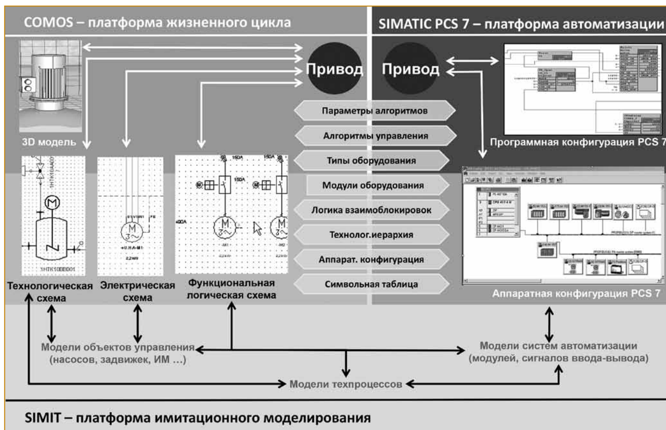
Рис. 1. Схема комплексного проектирования предприятия на базе продуктов Siemens

питания), схем размещения объектов, конструкторской документации на системы автоматизации, алгоритмов систем управления технологическими процессами, математических моделей технологических процессов и другой проектной и сопроводительной документации (руководства и регламенты по эксплуатации, паспорта на основное и вспомогательное оборудование, шкафы автоматизации и др.).