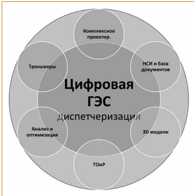
Рис. 3. Цифровая ГЭС

Цифровизация — это долгий сложный процесс, в который должны быть вовлечены все подразделения предприятия, в данном случае — ГЭС. За рубежом уже существуют должности — “цифровой инженер”, “цифровой офицер” — специалист, который поддерживает инфраструктуру цифрового производства. В основе цифровой ГЭС лежит комплексная система диспетчеризации (рис. 3).