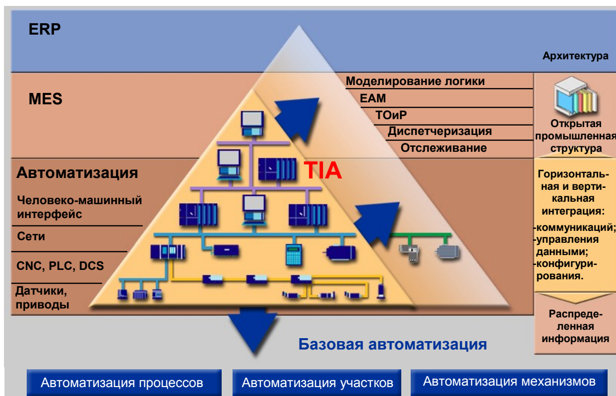
Рисунок 1 Комплексная автоматизация