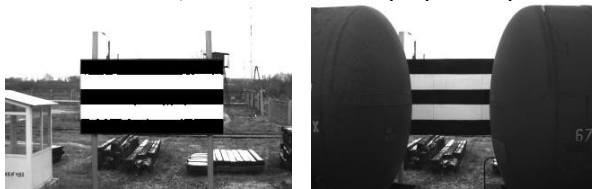
а) фоновый щит