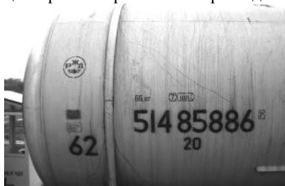
Рис. 1. Информация о цистерне: восьмизначный номер, тип (62) и код принадлежности стране (20)

В настоящее время на нефтеналивных терминалах актуальной становится задача автоматизации ТП наполнения железнодорожных составов цистерн и учета нефтепродуктов. Одной из важнейших задач автоматизации при этом является идентификация железнодорожных цистерн. Поступающие для налива нефтепродуктов цистерны имеют уникальные восьмизначные номера, двух- или трехзначные коды типа цистерны и двузначные коды принадлежности стране (рис.1). Для прибывающих составов эта информация по всем цистернам в кратчайшие сроки должна быть введена в АСУТП.